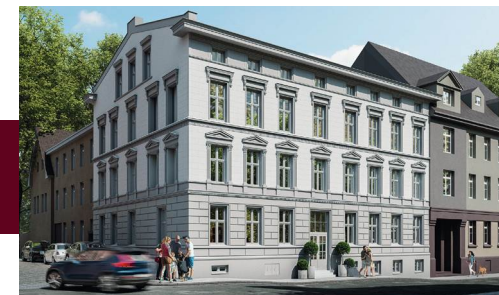
Widok budynku od strony ulicy

Unikatowe ozdobne ornamenty i detale na fasadzie kamienicy.