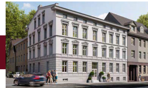
Widok budynku od strony ulicy

Unikatowe ozdobne ornamenty i detale na fasadzie kamienicy.