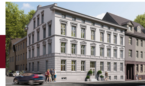
Widok budynku od strony ulicy

Unikatowe ozdobne ornamenty i detale na fasadzie kamienicy.